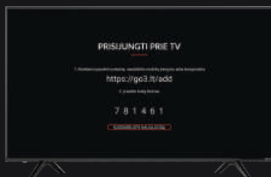
TV ekrano vaizdas