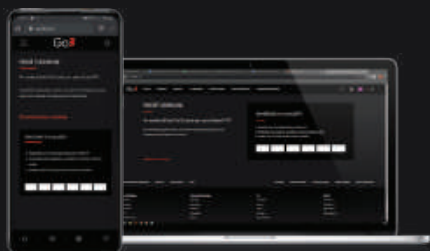
Įrenginio ekrano vaizdas

Kodą, kurį matote TV ekrane, įveskite į baltus langelius. Kodas gali būti įvestas tik jūsų kompiuteryje arba telefone - televizoriaus naršyklėje atlikti šio veiksmo galimybės nėra.